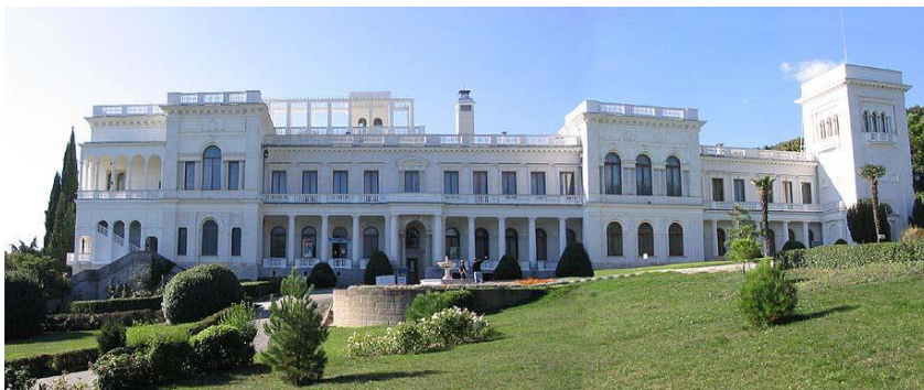
Toeristische attractie: Livadia paleis op de Krim

De sanctieregeling van 18 december 2014 bevat verbodsbepalingen op “het verrichten van diensten die direct verband houden met toeristische activiteiten in de Krim of in Sebastopol”. Er staat bij dat het verbod zich met name richt op cruiseschepen die een van de havens van het schiereiland willen aandoen. De verbodsbepaling maakt het voor EU ondernemers lastig om zich met toerisme uit de EU op de Krim bezig te houden. Wat in elk geval wel mogelijk is, is om individueel een vliegticket naar Moskou te boeken en vervolgens met Aeroflot naar Simferopol (hoofdstad van de Krim) te vliegen. Hotels kunnen onder andere nog gewoon via hotel boekingsites worden geboekt. De vraag die dan opkomt is: indien het doel van de reis zakelijk of studie is, dan kan men zich met inkomend toerisme bezig houden en aan dergelijke reizigers diensten verlenen. Wanneer een hotel wordt geboekt, wordt niet gevraagd of het doel van de reis zakelijk dan wel privé is. Hoe het zit met verzekeringen? Over het algemeen wordt direct spoedeisende medische hulp door de ziektekostenverzekeraar vergoed, afgezien van het feit dat dit op de Krim wordt verleend aangezien het gaat wereldwijde dekking betreft. Voor de reis-, en bagageverzekering gelden andere regels. Nu voor de Krim (en Oost-Oekraïne) een negatief reisverbod geldt, geldt de reis-, en bagageverzekering daar niet.