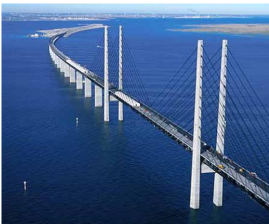
Brug die in de toekomst Kertsj met haven Kavkaz verbindt.